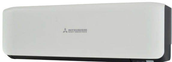
SRK-ZS-W(B), Contrast zwart-wit