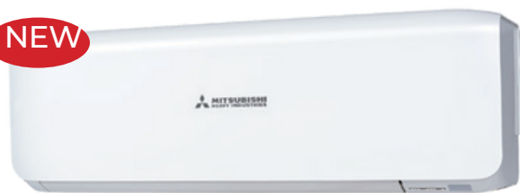
SRK-ZS-W, Wit RAL9003